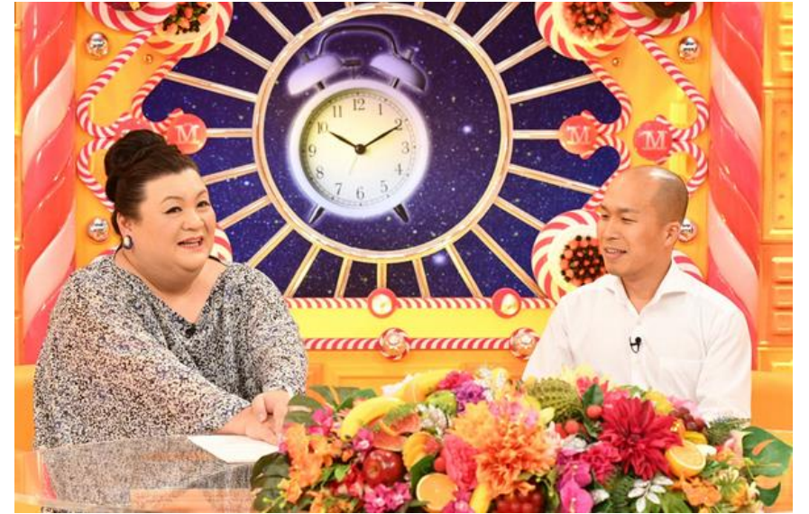
画像：TBSマツコの知らない世界出演時